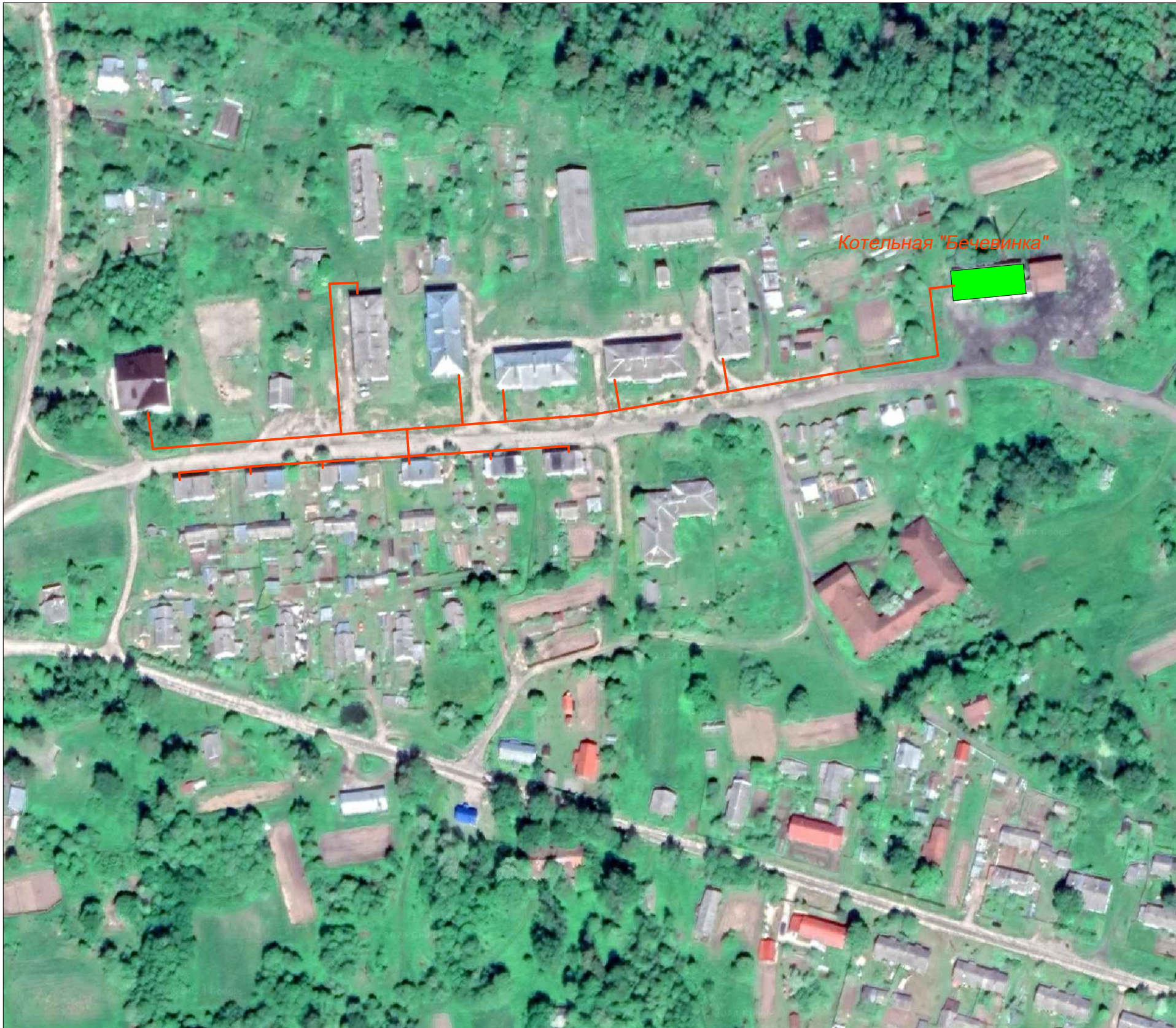
Схема теплоснабжения котельной "Бечевинка", фрагмент территории М1:2000