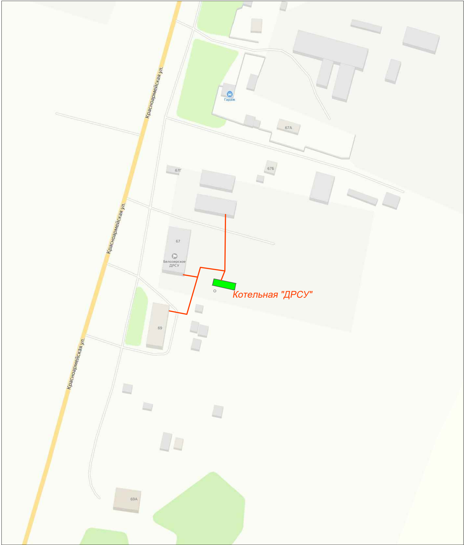
Схема теплоснабжения котельной "ДРСУ", фрагмент территории М1:2000